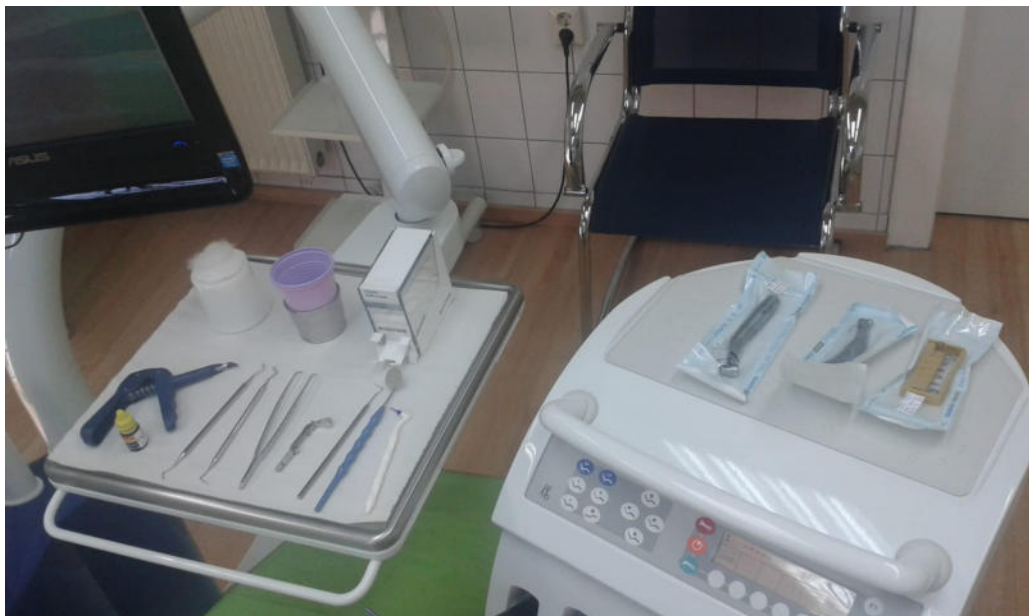
Der Arbeitsplatz einer zahnmedizinischen Fachangestellten

Trotz alldem hat mir der Beruf zugesagt und ich könnte mir auch gut vorstellen, diesen Beruf zu erlernen. Im Allgemeinen hat mir die Woche sehr viel Spaß gemacht und ich habe viel Neues dazu gelernt. Das Praxisteam hat mich gut aufgenommen und ich habe mich schnell eingefunden. Ich kann es euch nur ans Herz legen, mal ein Praktikum in einer Zahnarztpraxis zu machen, um einfach mal Erfahrung zu sammeln.